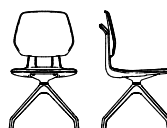
CASHY SPECIAL SWIVEL CHAIR 4S