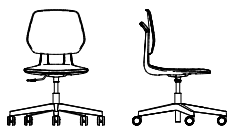
CASHY SPECIAL SWIVEL CHAIR 5A